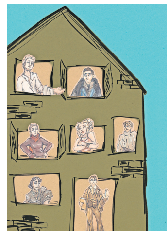
Grafik: Elisa Eberlein und Jolina Bassow

„Der Biberpelz“, 6. Juni, 18:00 Uhr, Ateliertheater