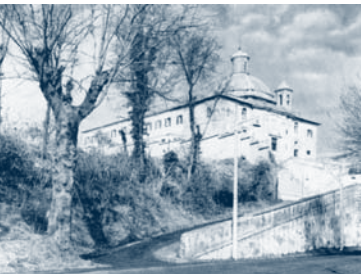
Kloster Santa Maria del Rosario, Rom,