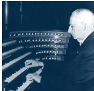
Marcel Dupré (1886 – 1971)