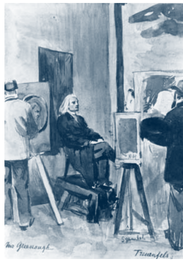
Liszt sitzt bildenden Künstlern in Rom Modell