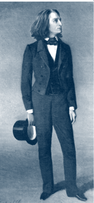
Gemälde von R. Lauchert, 1856

Während das Präludium und Fuge über den Namen BACH in der Orgelversion erklingt, wird »Ad nos, ad salutarem undam«, die 1850 für Orgel solo komponierte Fantasie und Fuge über einen Choral aus Giacomo Meyerbeers Oper »Le Prophète«, in der Bearbeitung für Orgel und Orchester des legendären Pariser Organisten Marcel Dupré aufgeführt. Beide Orgelwerke stehen in engem Zusammenhang mit der Ladegast-Orgel im Dom zu Merseburg. Zu deren Einweihung am 25. September 1855 war eigentlich Liszts Präludium und Fuge über BACH vorgesehen, deren Komposition allerdings nicht rechtzeitig abgeschlossen werden konnte. Stattdessen wurde Liszts Fantasie und Fuge über »Ad nos ...« von 1850 gespielt. Liszt hatte nach der Uraufführung von Meyerbeers »Le Prophete« im Jahre 1849 zunächst drei Klavierparaphrasen über Themen aus der Oper geschrieben. Seinem etwas später entstandenen Orgelwerk legte er den auf ein jüdisches Lied zurückgehenden Choral der Wiedertäufer aus dem 1. Akt zugrunde, welcher zum Ausgangspunkt für die dreiteilige Orgelkomposition wurde.